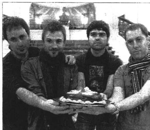
Los miembros del grupo, ayer, en el Teatro Arriaga.

Por otro lado, un total de 193 jueces están llamados a votar el próximo día 26 en los comicios que permitirán conformar la nueva Sala de Gobierno del Tribunal Superior. Los miembros de la judicatura podrán designar entre cuatro listas abiertas —de las asociaciones APM, JpD, Jueces de Pueblo y No Asociados— a los seis integrantes elegibles de un órgano que componen en total 13 magistrados.