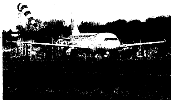
Un avión aterriza en Hondarribia.

Cabe recordar, en relación al aeródromo guipuzcoano, que el Parlamento Vasco instó la semana pasada al Ejecutivo de Gasteiz a promover la ampliación del mismo.