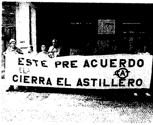
Delegados sindicales de CAT y ELA en la puerta de acceso a la sede del PSE.

La Sociedad Estatal de Participaciones Industriales (SEPI) mantiene que el acuerdo alcanzado con UGT y CCOO que establece el holding entre las cuatro adjudicatarias de los astilleros de Gijón, Sestao, Sevilla y Manises «no se va a mover», aunque se sabe que los responsables de ambos sindicatos han presentado algunas modificaciones al texto final de mayo, debido al fuerte rechazo entre su militancia. Los problemas de la operación no son sólo de carácter laboral, sino de continuidad de algunos centros.